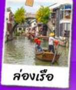
คลองเรือ