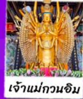
เจ้านม่กวนฉิม