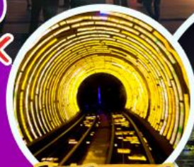
อู๋มองด์เคเซอร์